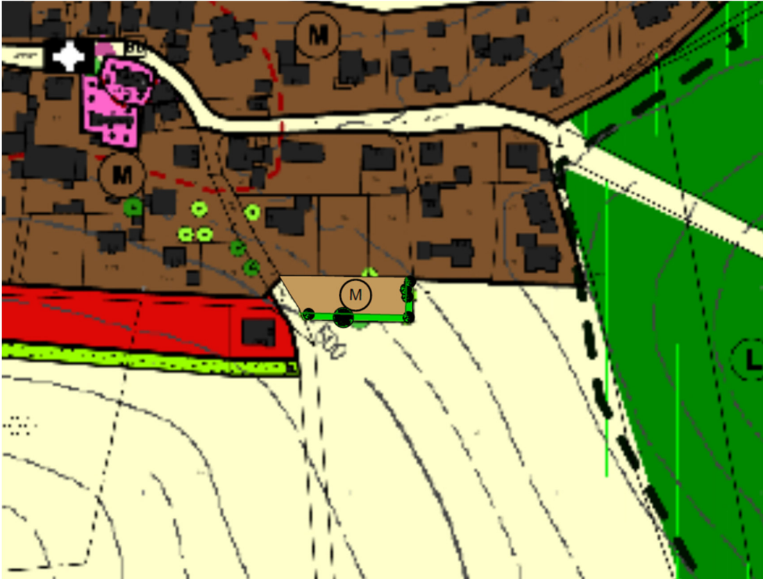
FNP Kipfenberg nach der Änderung