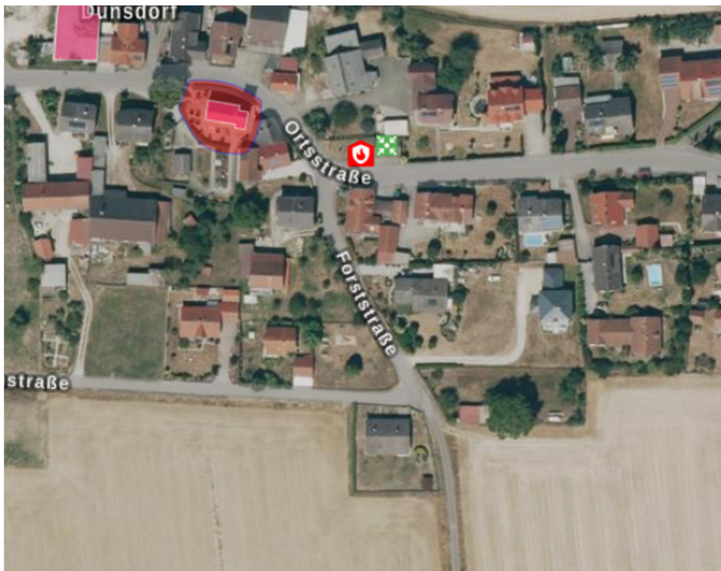
Auszug aus dem Bayernviewer Denkmal

Gemäß dem Bayern Viewer Denkmal des Bayerischen Landesamtes für Denkmalpflege sind im Geltungsbereich der Einbeziehungssatzung „Haas“ keine Bodendenkmäler vorhanden.