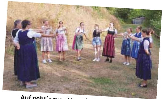
Auf geht's zum Limesfest – Volkstänze, Maßkrugstemmen und Co.