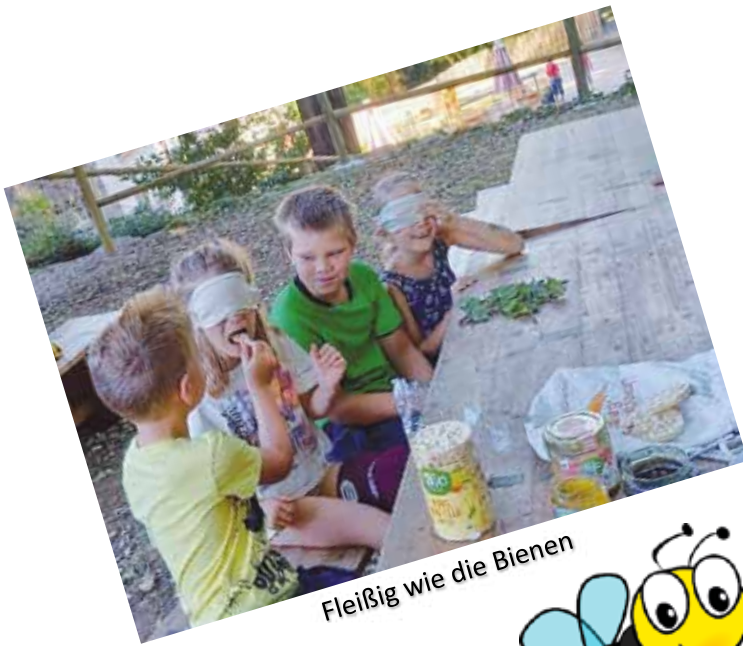
Fleißig wie die Bienen