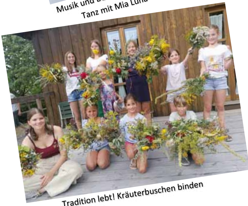
Tradition lebt! Kräuterbuschen binden