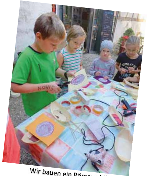
Wir bauen ein Römerschiff