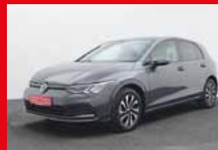
VW Golf 8 Active 1.0 TSI, 81 kW (110 PS)

EZ 09.2021, 25.560 km , Anschlussgarantie 3 Jahre, max. 100.000 km, Navigationssystem Discover Media, LED Scheinwerfer, Verkehrszeichenerkennung, Radio DAB, 3-Zonen Klimaautomatik, uvm.