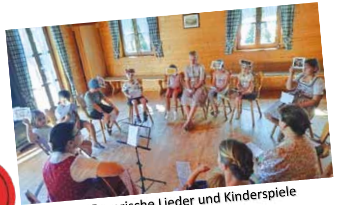
Bayerische Lieder und Kinderspiele