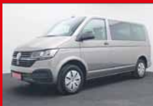
VW T6.1 Multivan 2.0 TDI, 110 kW (150 PS)

EZ 11.2020, 10.600 km , 7 Sitzplätze, Standheizung, Parksystem vorne und hinten inkl. Rückfahrkamera, ACC Abstandstempomat, Klimaautomatik, Multifunktionslederlenkrad, uvm.