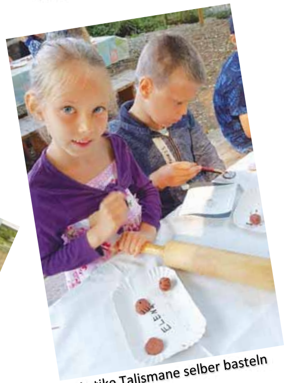
Antike Talismane selber basteln