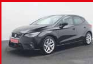
Seat Ibiza FR 1.0 TSI DSG, 81 kW (110 PS)

EZ 04.2021, 15.360 km , Navigationssystem, Leichtmetallfelgen 17 Zoll, LED Scheinwerfer, Panoramadach, Parksystem vorne und hinten inkl. Rückfahrkamera, Sitzheizung vorne, Sitzbezüge Alcantara, Radio DAB, uvm.