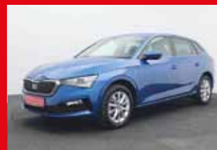
Skoda Scala 1.0 TSI, 81 kW (110 PS)

EZ 11.2021, 15.270 km , Anschlussgarantie 3 Jahre, max. 100.000 km, Infotainmentssystem Bolero, Parksystem vorne und hinten, LED Scheinwerfer, Sitzheizung vorne, Lederlenkrad beheizbar, uvm.