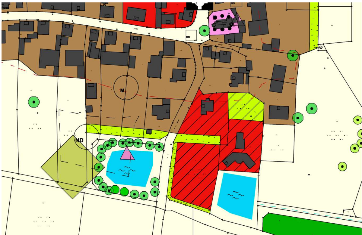
Flächennutzungsplan des Marktes Kipfenberg, Gemarkung Biberg, ohne Maßstab