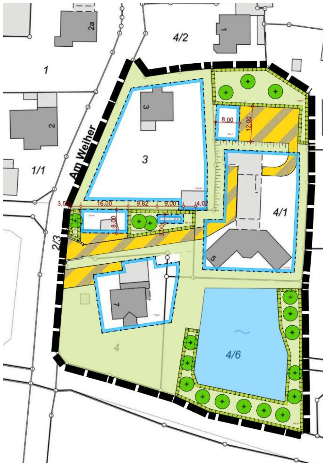
Planausschnitt der Einbeziehungssatzung ohne Maßstab

Der Geltungsbereich des einfachen Bebauungsplans nach der ersten Änderung umfasst die Flurstücke 3, 4/3, 4/1, 4/5, 4/4, 4 und 4/6 der Gemarkung Biberg. Die Fläche des Geltungsbereichs wird von ca. 6.630 m 2 auf ca. 8.515 m 2 erweitert. Dabei ist die Fläche einer Ortsrandeingrünung um den Weiher neu als Ausgleichsfläche für den Naturschutz integriert.