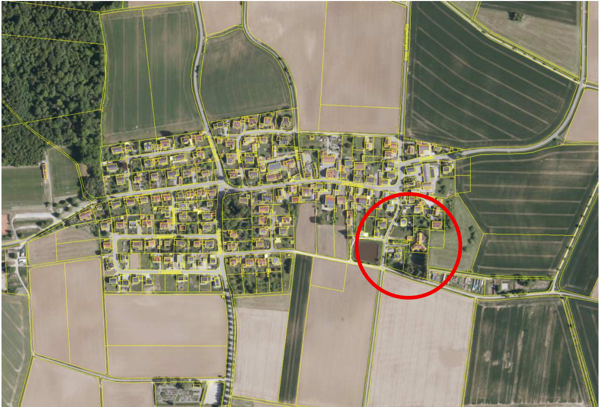
Lage des Planungsgebietes, Orthofoto der Bay. Vermessungsverwaltung, ohne Maßstab