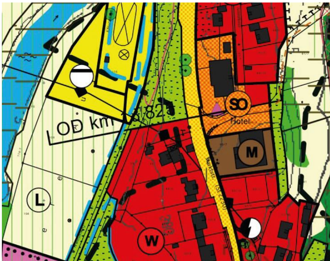
FNP Kipfenberg nach der Änderung