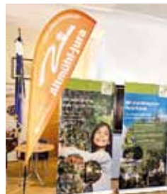
Links: Führung bei der Biogasanlage Grasser; Rechts: Ausstellung „Wir Bäume sind eure besten Freunde“ im Rathaus Berching.

Erfolgreiche Innenentwicklung: Beispiele gesucht Leerstände neu nutzen, Gebäude sanieren und kreative Wohn- und Nutzungskonzepte umsetzen. Kennen Sie spannende Beispiele oder möchten Sie eigene Erfahrungen teilen? Dann kommen Sie gerne auf uns zu! Für unseren Podcast und die Webseite suchen wir gelungene Beispiele aus der Region. Wenn Sie interessante Projekte kennen oder selbst Erfahrungen mit Innenentwicklung gesammelt haben, freuen wir uns über Ihre Hinweise. So möchten wir einen bunten Strauß an Möglichkeiten, Erfahrungen und Ideen aus der Region sichtbar machen und im Podcast sowie auf unserer Homepage vorstellen.